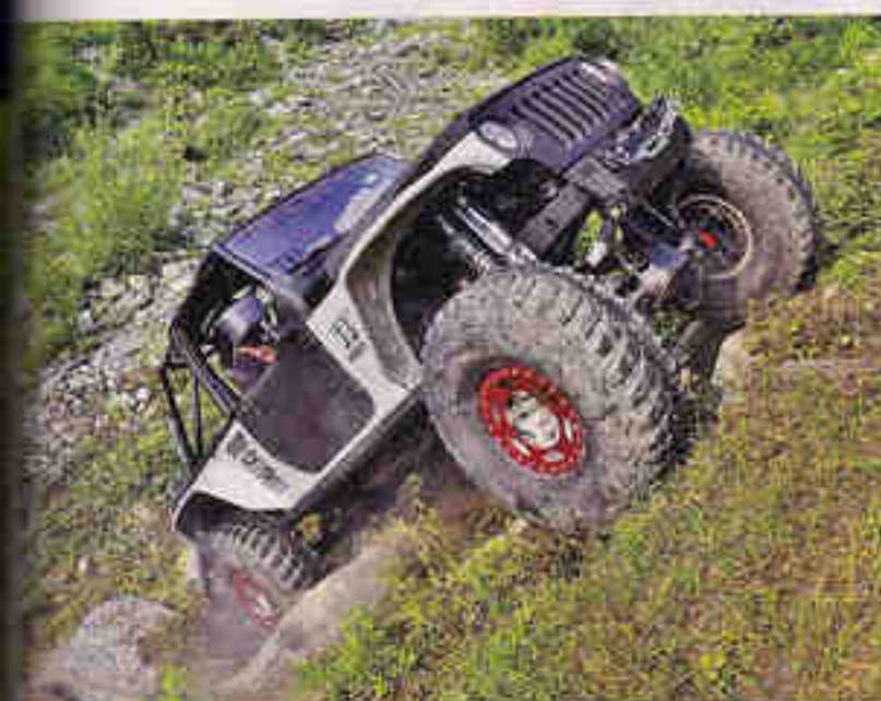
Il rivisto Protot XQuattro, con passo 111", ci prova, ma taglia una delle belle Goodyear in kevlar: la pietra di Luserna non fa sconti, neanche agli americani!