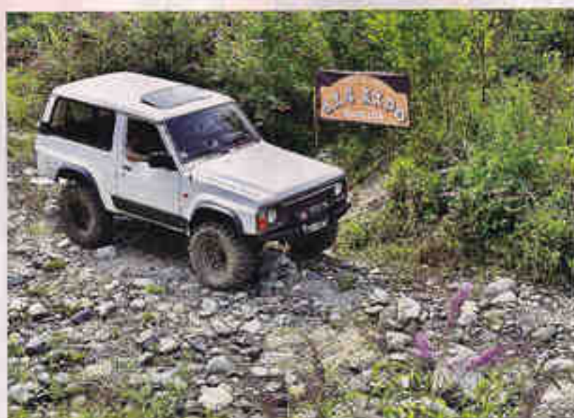
Offroad interessante, anche se non molto esteso, come potrebbe essere nell'area naturale. Forse mancavano difficoltà Intermedie... Ma ci sarà sempre la "quarta" edizione, no?

palatenda e parete di scalata artificiale. Accesso del pubblico gratuito, mentre a pagamento sono le belle visite guidate sulle Alpi Cozie, con tratti anche impegnativi, a scelta, attorno alle famose cave. Due aree trial, base ed avanzata (direi estrema), entrambe semi-naturali, ed un'area artificiale con blocchi di... pietra, che qui potremmo dire quasi naturale! Non mancava il